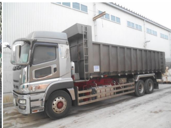
30m 3 BOXのダンプ