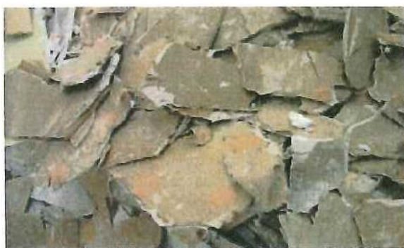
解体系廃石膏ボード