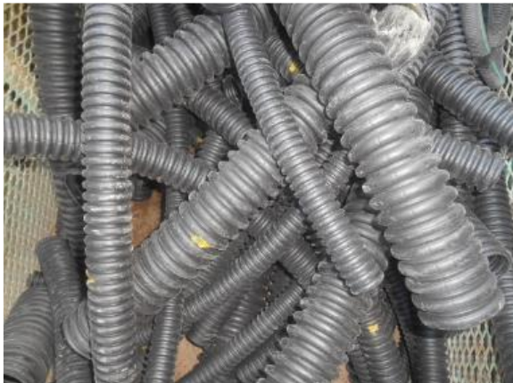
硬質廃プラスチック