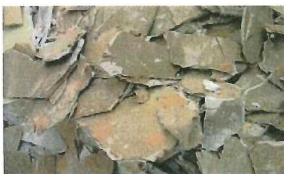
解体系廃石膏ボード